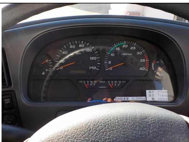
総走行距離状況(R4.2.1 現在 19,846km)