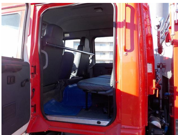
後部座席(助手席側)