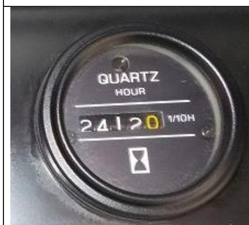
アワーメーター状況(R4.2.1 現在)