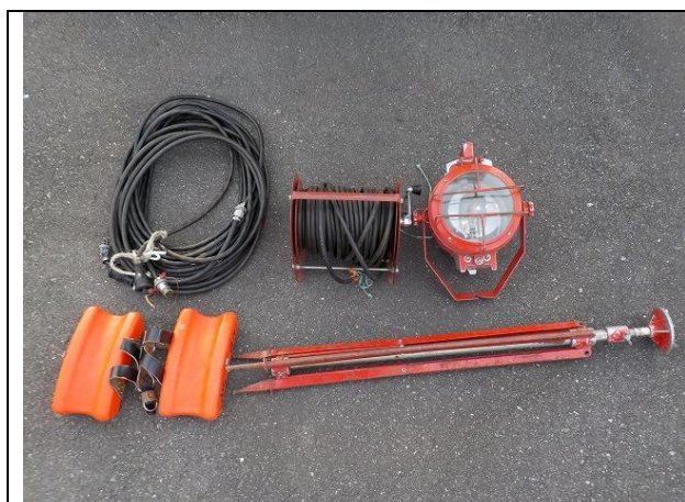
オイルパンヒーター線、枕木×2、灯光器一式