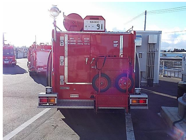
後面(シャッター閉)