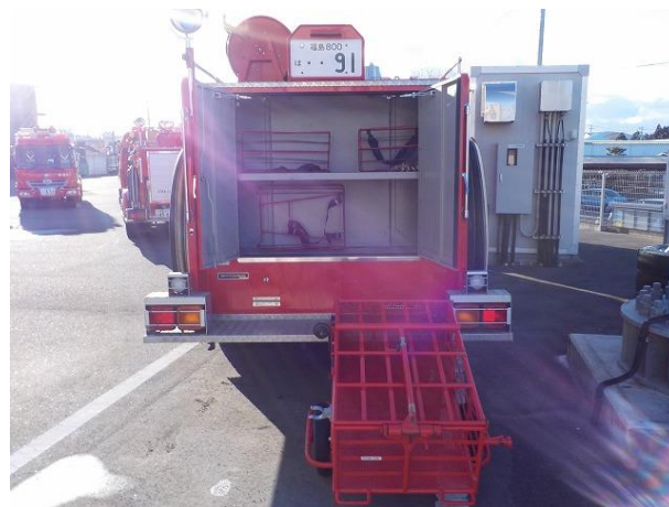
後面(観音扉開) ホース背負い具×3