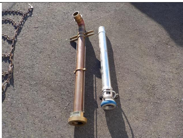
スタンドパイプ、高発泡ノズル