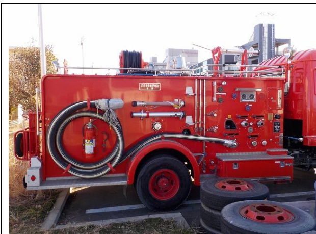
吸水管、高発泡ノズル、管そう、消火器