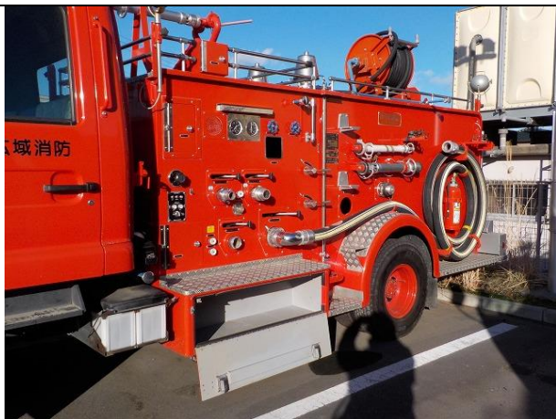
吸水管、高発泡ノズル、管そう、消火器