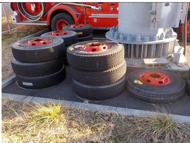
スタッドレスタイヤ 6本、スペアタイヤ 1本