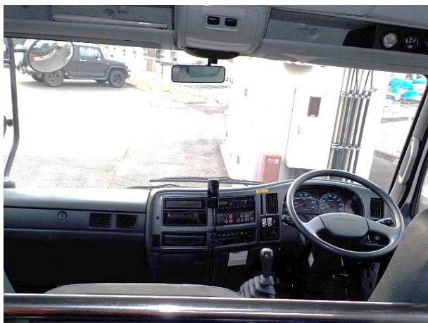
内部の状況(後部座席から)