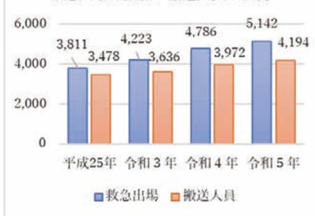
救急出場件数及び搬送人員の状況